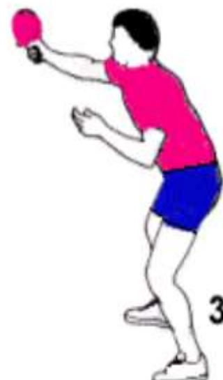
Ausschwingen in Schlagrichtung

Schläger leicht geschlossen Treffpunkt vor dem Körper - Handgelenkeinsatz