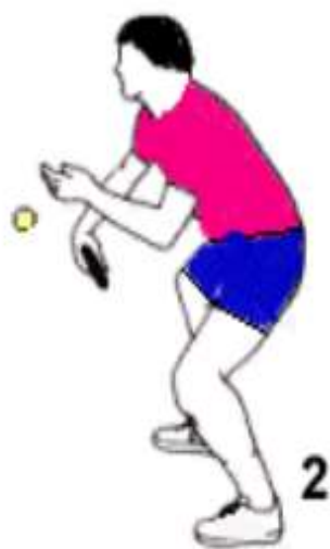
leichte Linksdrehung der Schulter

Schläger leicht geschlossen Treffpunkt vor dem Körper - Handgelenkeinsatz